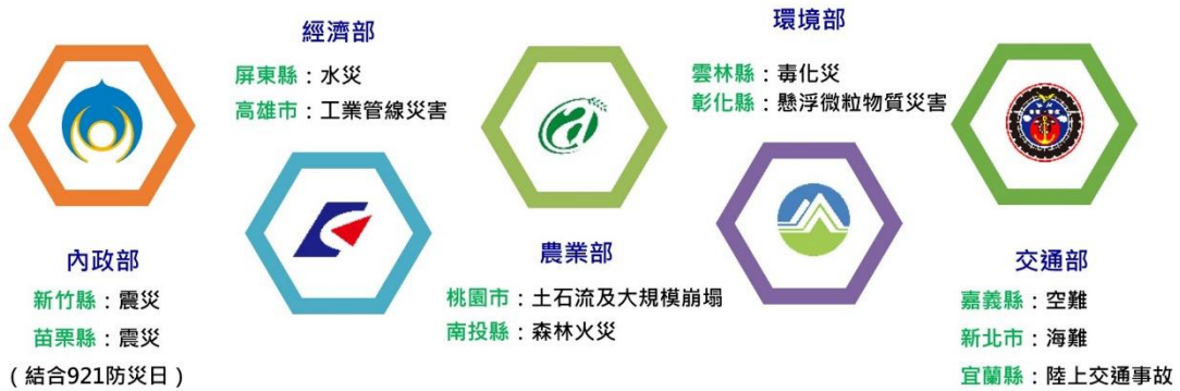
圖 4 演習規劃主辦、執行單位及其災害主題 (資料來源：本研究整理)

依循行政院災防辦的規劃，災防科技中心參與演習人員於 1 月完成線上「災害防救演習規劃與評估」系列課程，2 月至 9 月作為演習規劃機關（單位）成員，參與每縣市召開的 3~5 場演習規劃會議，詳