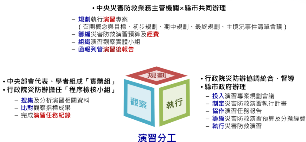
圖 1 演習分工方式及辦理事項

第 3 條及第 23 條的精神（回歸中央與地方等各級單位實施演習之法 定義務），演習分工方式為演習規劃、演習執行、演習觀察，由災害 防救業務主管機關（內政部、經濟部、交通部、環境部、農業部）擔 任演習規劃主辦，各地方政府為演習執行機關，兩者共同辦理災害防 救演習及觀察作業。其演習分工方式及辦理事項如圖 1 所示。