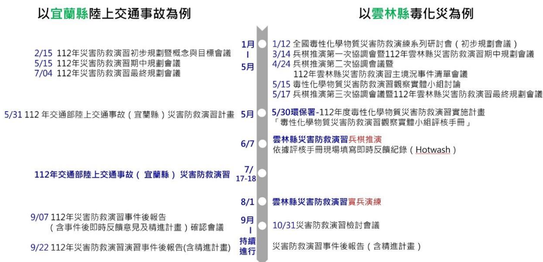
圖 6 災防科技中心參與雲林縣、宜蘭縣災防演習相關會議時序