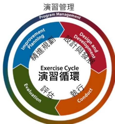
圖 2 演習規劃的循環