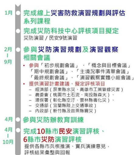
圖 5 災防科技中心參與縣市災防演習時序

細討論各縣市演習範疇、境況，結合中央災害防救業務計畫與地區災害防救計畫內涵，擬定相關設定與目標。並於 4 月正式演習時擔任演習觀察實體組成員，參與時序如下圖 5。以 112 年度毒性化學物質災害防救演習（雲林縣） [7] 及交通部陸上交通事故（宜蘭縣）112 年災害防救演習 [8][9] 為例，演習規劃會議時間集中在 2 月至 5 月且互有重疊，必須投入大量時間及人力參與。辦理災防演習的 11 縣市中，災防科技中心總計參與 8 縣市的規劃相關會議，擔任 6 縣市的演習評核官，以及 8 場次觀察者（如表 1）。